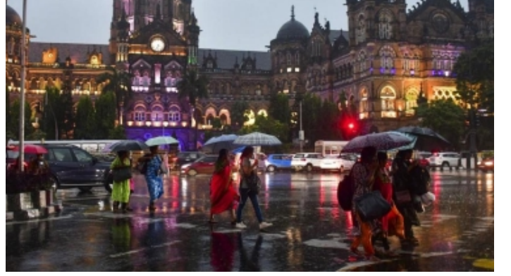
ভারী বৃষ্টিতে বিপর্যস্ত মুম্বাই