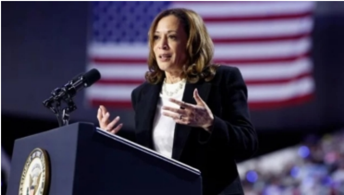
এবার কমলা হ্যারিসের প্রচার শিবিরে বন্দুক হামলা