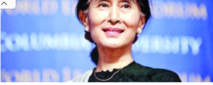
সুচিকে ভ্যাটিকানে আশ্রয়ের প্রস্তাব পোপের