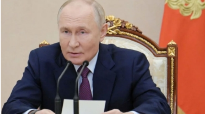
পশ্চিমা বিশ্বকে 'পারমাণবিক হামলার' হুঁশিয়ারি দিলেন পুতিন