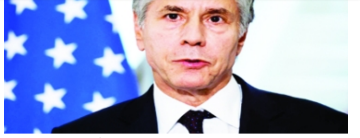
ব্লিনকেনের বিরুদ্ধে পার্লামেন্ট অবমাননার অভিযোগ