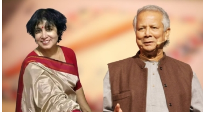
বাংলাদেশে ফিরতে ড. ইউনূসকে নিয়ে যে কাণ্ড করে বসলেন তসলিমা নাসরিন