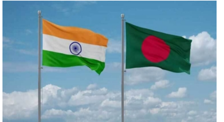
ভারতবিরোধিতার প্রভাব বাণিজ্যে পড়লে ক্ষতি হবে বাংলাদেশের