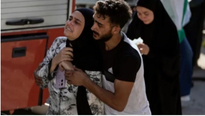
লেবাননে আবারো ইসরায়েলের হামলা, নিহত ৭২